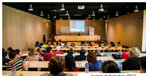
Journée de formation (2017)