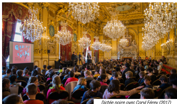
Dictée noire avec Caryl Férey (2017)

Inscription gratuite et obligatoire dès janvier 2018. Dans la limite des places disponibles (une à deux classes par établissement).