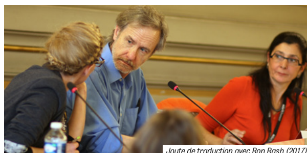
Joute de traduction avec Ron Rash (2017)

Inscriptions par mail. Attention : Du fait du nombre limité de places, seules les premières classes à se manifester pourront y être inscrites. Afin de rémunérer l'auteur pour cette rencontre, nous demanderons à chaque classe une participation de 50€.