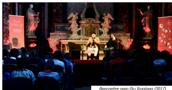
Rencontre avec Qiu Xiaolong (2017)