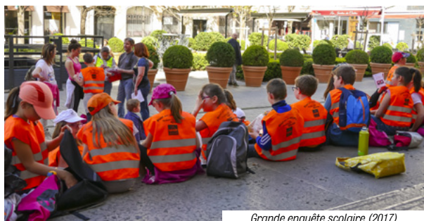
Grande enquête scolaire (2017)

Inscription obligatoire et gratuite auprès de Quais du Polar à partir du 27 novembre 2017. Clôture des inscriptions le 21 janvier 2018. Dans la limite des places disponibles. En raison d'une forte demande et pour permettre au plus grand nombre de profiter de cette activité, nous limitons la participation à deux classes, de 30 élèves maximum, par établissement.