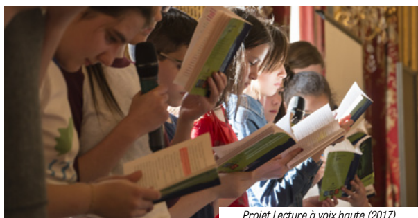
Projet Lecture à voix haute (2017)