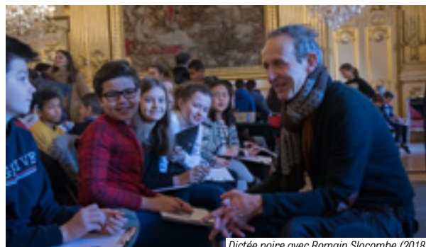
Dictée noire avec Romain Slocombe (2018)

Entre janvier et mars, les jeunes jurés des écoles participantes se seront familiarisés avec les 5 titres en lice au cours de séances animées par les Ambassadeurs du Livre, encadrés par l'Association de la fondation étudiante pour la ville (Afev). Les classes participantes pourront rencontrer l'auteur lauréat au cours d'une grande rencontre qui aura lieu à la suite de la remise du prix.