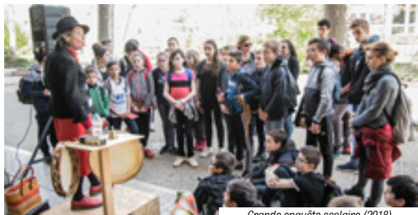
Grande enquête scolaire (2018)

Inscriptions gratuites et obligatoires auprès de Quais du Polar à partir de janvier 2019. Clôture des inscriptions le 27 janvier 2019. Dans la limite des places disponibles. En raison d'une forte demande et pour permettre au plus grand nombre de profiter de cette activité, nous limitons la participation à deux classes, de 30 élèves maximum, par établissement.