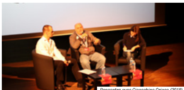
Rencontre avec Gioacchino Criaco (2018)