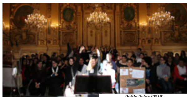
Battle Polar (2018)