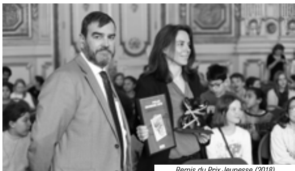
Remis du Prix Jeunesse (2018)