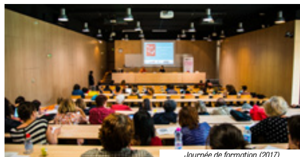
Journée de formation (2017)