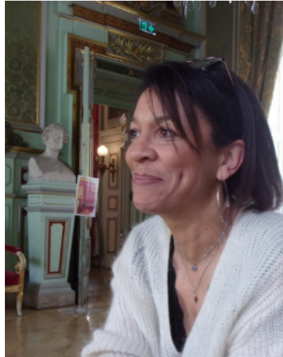
Rencontre avec une adhérente

Par ailleurs, la plupart des adhérents préfèrent acheter des livres ou investir dans une liseuse plutôt que d'aller en bibliothèque : ils aiment garder les savoirs qui sont dans ces écrits. Certains passionnés ont des amis tout aussi intéressés qu'eux, ce qui permet l'échange de manuscrits entre lecteurs. « J'habite dans un village donc ce n'est pas toujours très facile. J'aime avoir le livre, j'aime le garder [...] et en plus j'ai plein de copains, de copines qui lisent : on se prête pas mal de livres. Sinon, j'investis dans une liseuse ». Ils préfèrent les livres aux films en découvrant les sens et les énigmes cachés dans l'histoire.